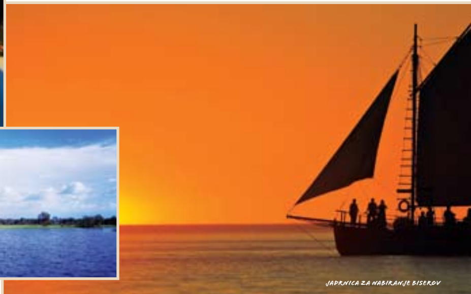
JAPRNICNA ZA NABIRANJE BISEROV