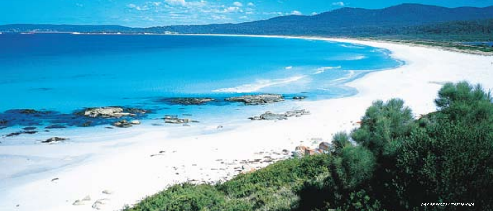
BAY OF FIRES / TASMANIJA

P ohodništvo v Avstraliji je odlična priložnost za tiste, ki si ne želite le običajnega potovanja, ampak živite aktivno življenje. Popestrite si raziskovanje dežele z udeležbo na vodenem pohodu. Ker je Avstralija raznolika dežela, popotnikom nudi številne možnosti. Spoznajte deželo na drugačen način, zlijte se z naravo, začutite spokojnost tasmanske obale ali brezmejnost oceana ob slikoviti Veliki oceanski cesti. Doživite Avstralijo na pristen, naravi prijazen način in občutite veličino matere narave.