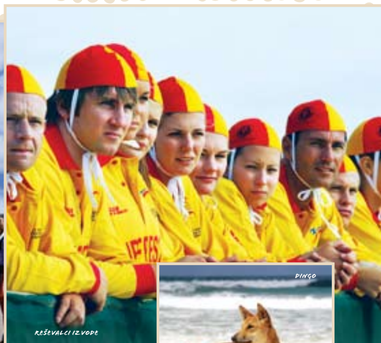
REŠEVALCI IZ VOPE