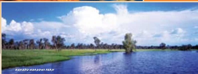
KAKABU NARODNI PARK

S te kdaj razmišljali, da bi odšli nekam, kjer bi lahko občutili vso spokojnost narave? Hkrati pa izživel strasti in si privoščili še kakšno adrenalinsko aktivnost? Vse to lahko doživite v zahodni Avstraliji, skoraj brezmejni deželi polni rdečega peska, razgibane pokrajine, narodnih parkov, slapov in osvežujočih rečnih tolmunov. Pokrajina The Kimberley vas bo navdušila s svojimi izjemnimi stvaritvami, ki se med popotovanjem po podeželju znova in znova kot film odpirajo pred očmi. Ljubitelji ptic ne pozabite na daljnogled. Popotovanje po prašnih podeželskih poteh se splača zaključiti v stilu. Privoščite si par dni oddiha na tropskem otoku Dunk Island. Bujna tropska vegetacija, toplo morje in prijazni ljudje... Vaše sanje lahko postanejo resničnost!