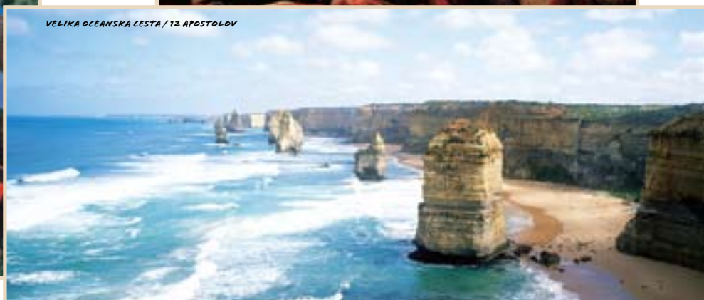
VELIKA OCEANSKA CESTA / 12 APOSTOLOV