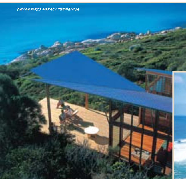
BAY OF FIRES LODGE / TASMANIJA